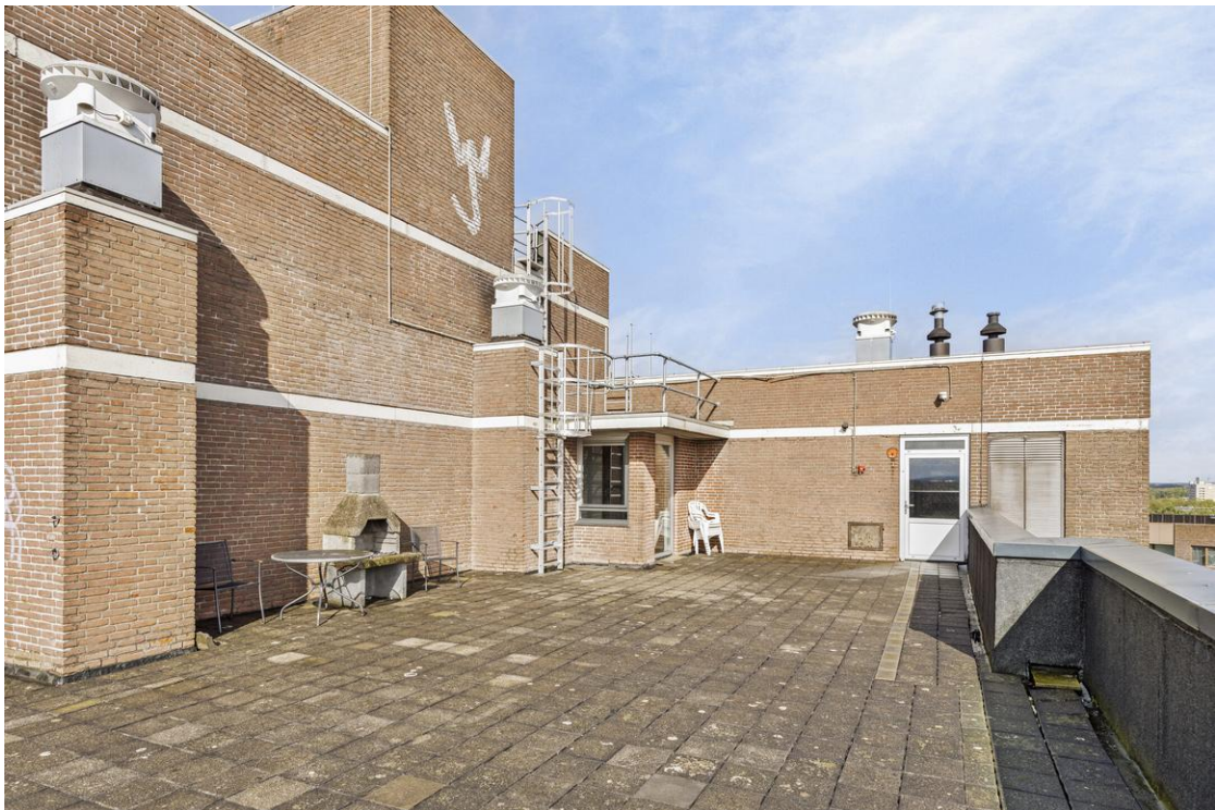
Het gemeenschappelijke dakterras